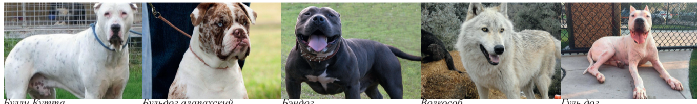
Булль Кутта, Бульдог алапахский чистокровный (отто), Бэндог, Волкособ, Гуль дог