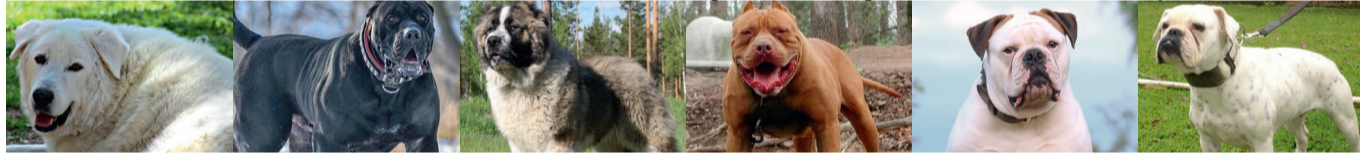
Акбаши, Питбульмастиф, Северокавказская собака, Американский бандог, Амбурдог, Бразильский бульдог