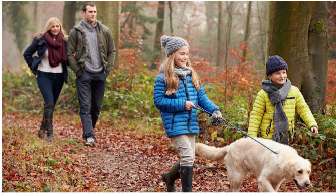
Во время прогулок в многолюдном лесу хозяева должны контролировать собак так же, как во дворе и на улице.

Такие встречи на лесной тропе случаются не только у нас. Ребята из спортивного класса рассказывают, что тоже видят «добрых собак» во время пробежек по лесу. И стараются – бочком, бочком –