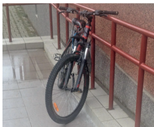
Велосипед, оставленный на пандусе, может помешать колясочникам.