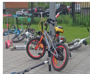
Фото: Григорий Михайлов / «Седьмая перемена». Площадка для «личного транспорта» в детском саду на Московской.

решить в неучебное время. В 7 часов 10 минут заканчивается урок, в восемь вечера мы должны ворота закрыть.