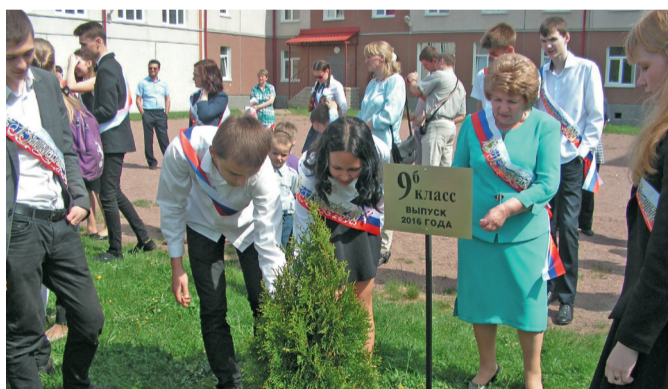
2016 год, посадка деревьев с 9б классом.

- Естественно. Я училась в Псковском педагогическом институте, мы каждые полгода куда-то отправлялись на практику. Помню, зимой нас привезли в лес, в специальный домик. Мы измеряли толщину снежного покрова. В Крыму были на горе Ай-Петри, посылали в институт камни горных пород, минералы. Когда работала в Сосновом бору, мы с ребятами постоянно куда-то