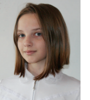
Беседовала Анастасия Томкив