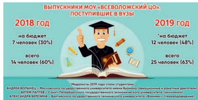
Инфографика: Екатерина Петухова / «СП».

признаются, что не учились, как надо. Досадно, когда видишь, что у ребенка мощный потенциал, но рядышком родилось что-то из четырех букв типа лени. Здесь