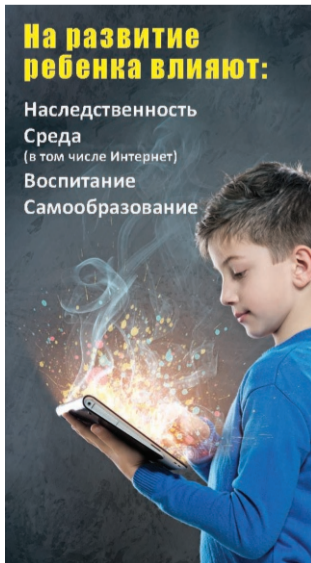
Инфографика: Станислав Райт / «Седьмая переменная».