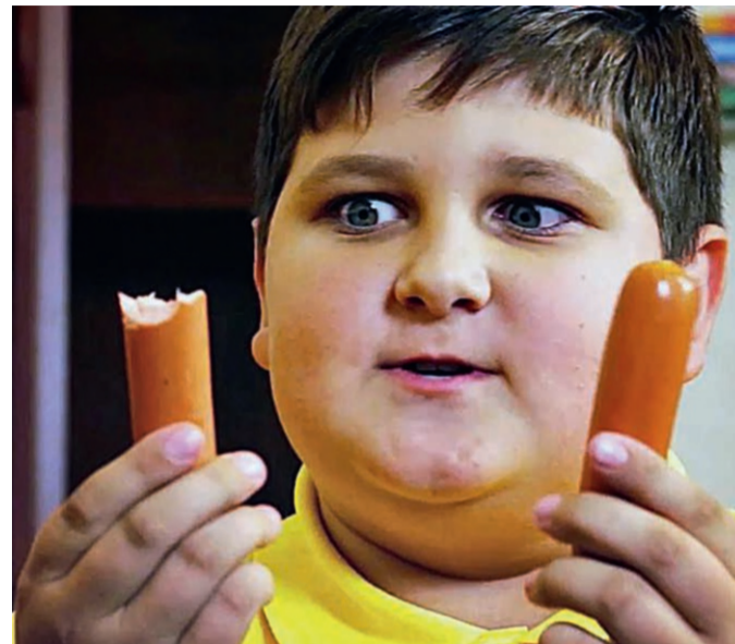
Фото: scale_1200. Современные школьники постепенно становятся рабами фастфуда.

Инфографика: Станислав Райт / «Седьмая переменная».