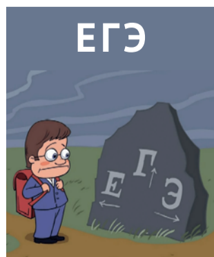
Инфографика: Евгения Райт / «Седьмая переменная».

читал и сдал — все же легко, а потом он вышел в жизнь и начал лечить ваших ро-