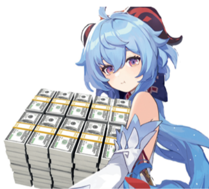
Коллаж: Алиса Одинокая. Вот такие симпатичные герои отбирают у наших детей деньги.

Я увлеклась все новыми и новыми сюжетами, обновлениями и режимами. Да и как не увлечься! Качество игры просто невероятное. И все очень красиво. Разработчики даже деньги у игроков отнимают красиво.