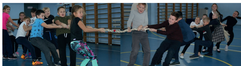
Команда 4г (справа) выглядела сильнее, но в перетягивании каната трудно предсказать результат!

В МОУ «Всеволожский ЦО» прошли первые соревнования по перетягиванию каната