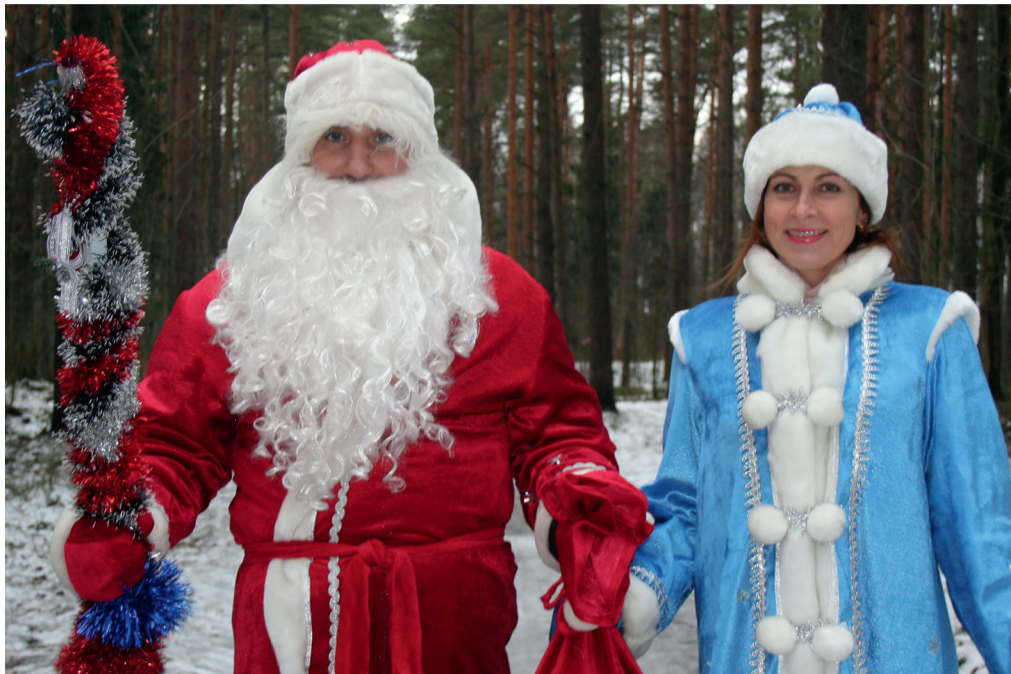
Вот они, всенародно избранные Дед Мороз и Снегурочка! Такое впечатление, что они действительно пришли к нам из леса.

Ребята одного из классов после голосования уходили, маршируя и скандируя: «Дед Мороз! Дед Мороз!»