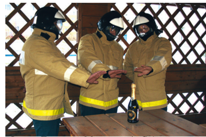
Во время новогоднего дежурства пожарные-спасатели будут пить сок.

но проверяют пожарно-техническое вооружение – рукава, стволы и т.д. Дежурство проходит в усиленном режиме.