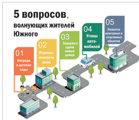
Инфографика: Екатерина Петухова / «Седьмая перемена».

Дарина Кодзокова, Кристина Мокроусова, Мария Кирьянова, Екатерина Плюснина