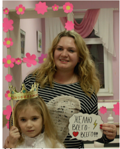
Мама и дочка в фотозоне.

Родителей встречали участники концертной программы. Они предлагали билеты беспроигрышной лотереи, в которой разыгрывались места в тематическом зрительном зале. Одни зрители попадали в Киевскую Русь, другие – на туристическую поляну, в фанзону и даже в баню.