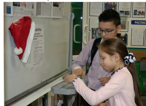
Фото: Григорий Михайлов / «Седьмая перемена». Школа бурлила весь день, пока шло голосование.

Школа забурилась с самого утра. На переменах ученики устремлялись на избирательный участок. Я спросила, за кого они отдадут голоса. «За директора, потому он самый главный», «Вероника Сергеевна классная и добрая», «Мы любим Марию Сергеевну». Для многих выборы новогодних персонажей превратились в голосование за своих преподавателей.