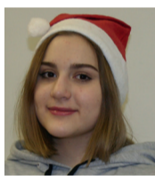
Беседовала Алена Максимова

— Найти свою книгу и с удовольствием прочитать!