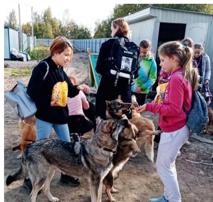
«Волонтеры Южного» приехали в приют для животных.

Волонтер — это человек, помогающий окружающим безвозмездно, а не за деньги или баллы. Когда видишь благодарные глаза, появляется радость, чувствуешь прилив новых сил.