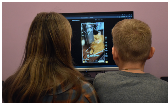
Фото: Маргарита Напалкова / «Седьмая переменная». У Симбы появились еще два подписчика...

Артем еще и разработчик игр, но подает их так, будто все делает кот. И дети в это верят. Самой популярной стала игра