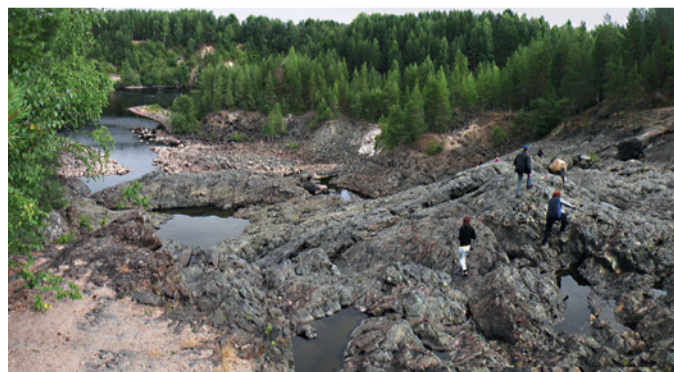
Фото: vseгда-pomnim.com. На вулкане Гирвас.

Возле водопада много тропинок, спусков, мостиков,