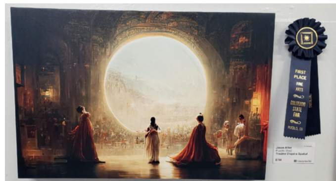
Картина, нарисованная нейросетью, победившая на государственной выставке штата Колорадо (США).