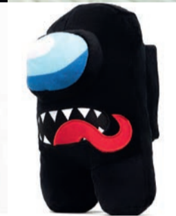
Фото: market.yandex.ru, aliexpress.ru. В верхнем ряду SCP 173, Флиппи и Флиппи. В нижнем ряду Зомби в коричневом пиджаке и Among us.

«Счастливые лесные друзья» созданы в 1999 году. Самая первая серия называлась «Banjo Frenzy» («Безумное банджо»). Жанр мультфильма — черный юмор. Один из героев — Флиппи, как ни странно, это зеленое существо... медведь, он был на войне и теперь имеет посттравматическое стрессовое расстройство. Все персонажи сериала — маленькие зверьки, с которыми постоянно случаются приключения, в ходе которых что-то идет не так. Неизменно одно — в конце будет погром.