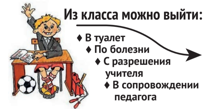
Инфографика: Станислав Райт / «Седьмая перемена».