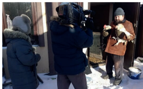
Фото: Телеканал «Культура».