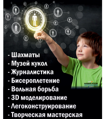
Инфографика: Екатерина Петухова / «Седьмая перемен».

Отделение доп. образования ВЦО на Невской, 10: