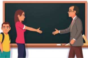
Инфографика: Станислав Райт / «Седьмая перемена».