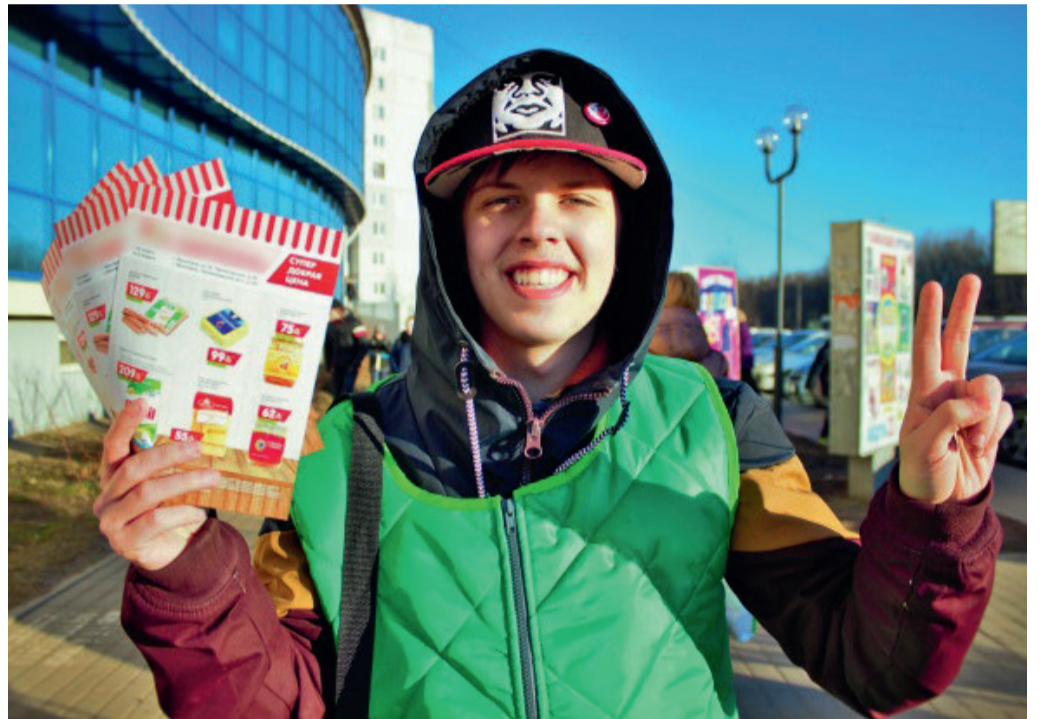
Таких активных подростков на наших улицах сейчас много.

Теперь очередь Ани. Она подбегает к трем пожилым женщинам и молча протягивает листовки. Те спокойно берут по одной. Все, мы больше не стесняемся. Де-