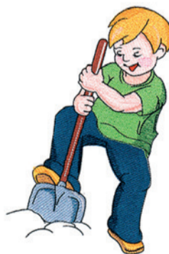
Инфографика: Станислав Райт / «Седьмая переменная».